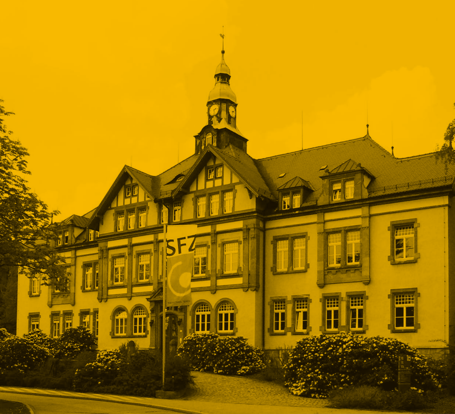
SFZ Förderzentrum gGmbH, Haus 1