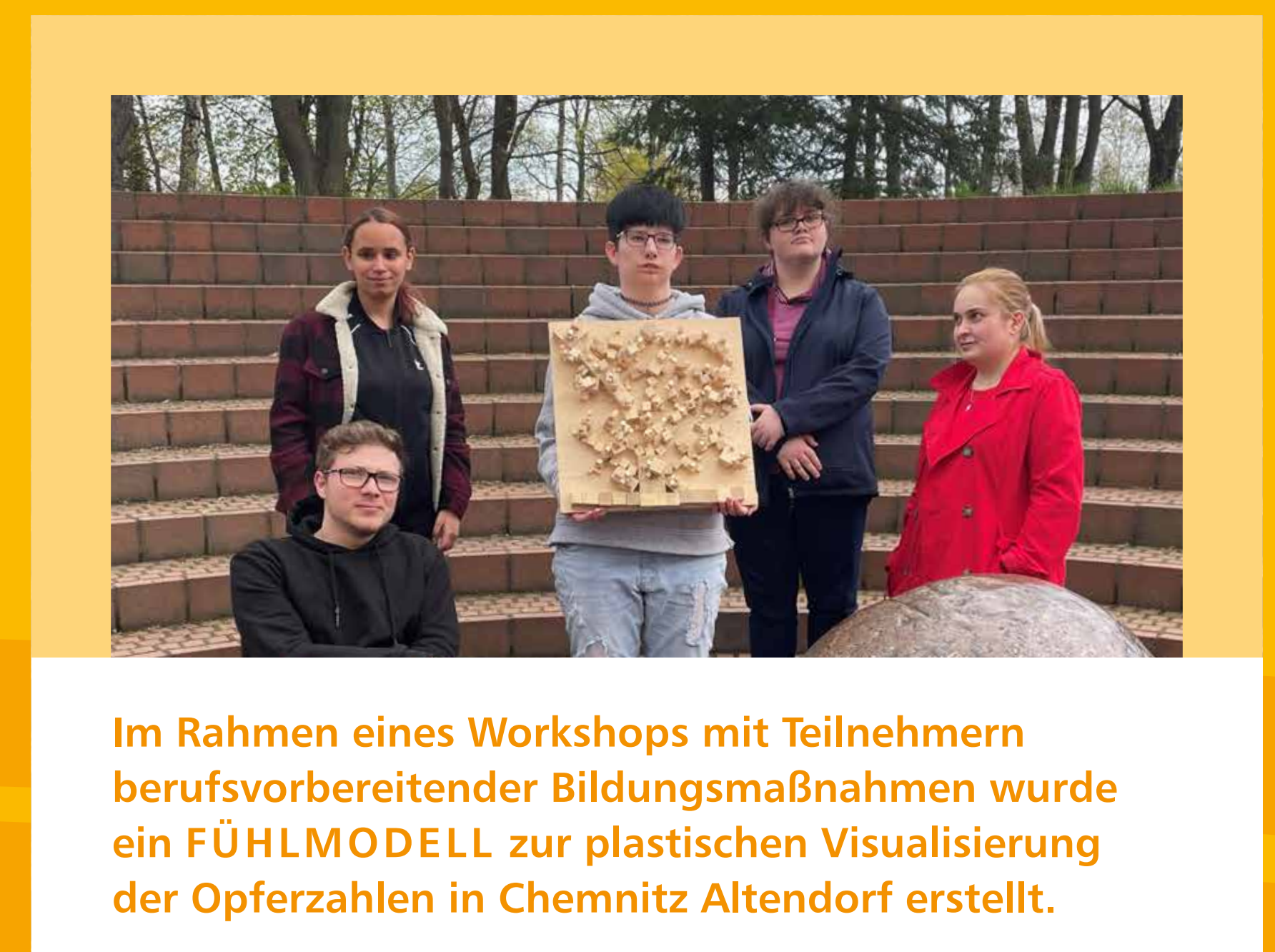
Im Rahmen eines Workshops mit Teilnehmern berufsvorbereitender Bildungsmaßnahmen wurde ein FÜHLMODELL zur plastischen Visualisierung der Opferzahlen in Chemnitz Altendorf erstellt.