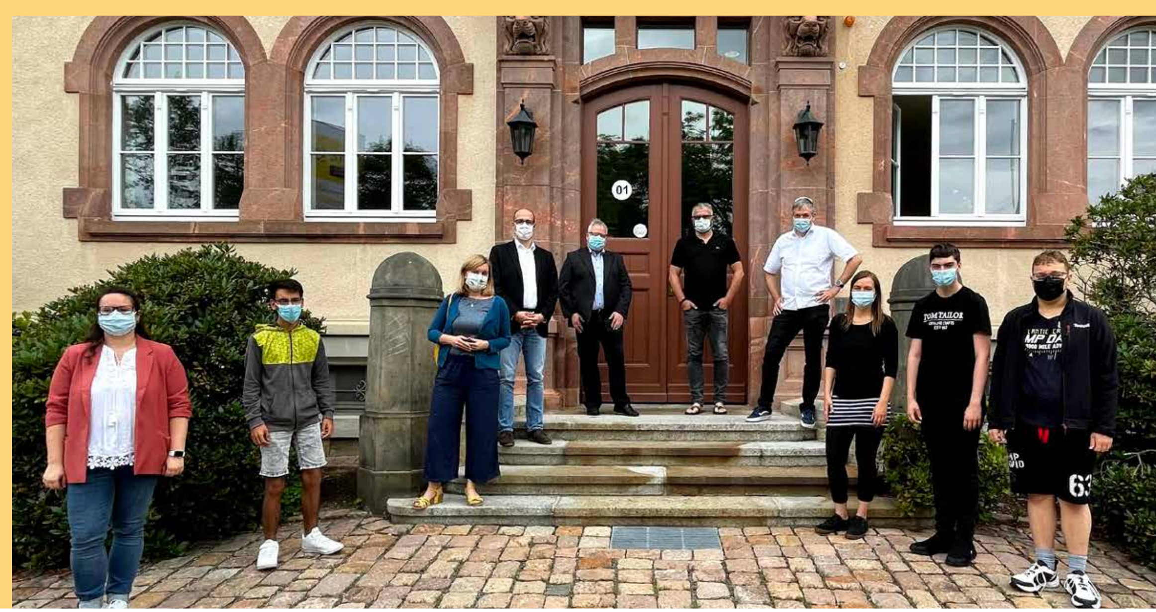
TEILNEHMER DES WORKSHOPS begrüßen gemeinsam mit Netzwerkpartnern des Projektes „Unantastbar Mensch“ Hanka Kliese (SPD).

Ohne die Initiative unseres Netzwerkes „Unantastbar“ würde es das Projekt der SFZ Förderzentrum gGmbH nicht geben.